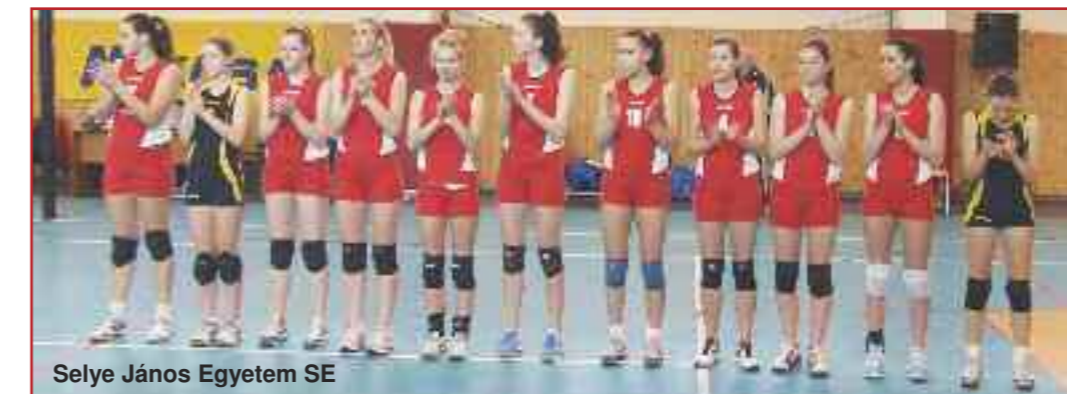
Selye János Egyetem SE