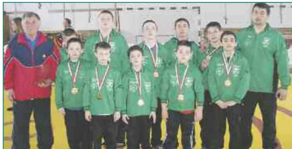
A bronzérmes madari csapat