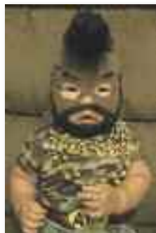
Kézdődik a farsang

- Ez még nem, de én meg azt hittem, hogy állok, és kiszálltam.