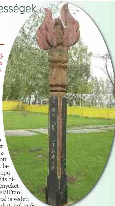
Lármafa - az ellenség közeledését, a közvetlen veszélyt fény- és füstjelekkel jelző hírközlő eszköz

A lármafa magaslatokon elhelyezett, az ellenség közeledését, a közvetlen veszélyt fény- és füstjelekkel jelző hírközlő eszköz. Földbe ásott 8-9 m hosszú rúd, amelynek felső részére szurkos szalmacsóvákat kötnek. A szalmakötél vége, amellyel az egészet körültekerik, leér egészen a földig, és a mellé rendelt őrszem azt gyújtja meg, amikor az ellenséget észleli. Éjszaka a lármafa fénye, tüze adott jelt a katonaság mozgósítására és a lakosság menekülésére. Az erdélyi települések vezetői 1788-ban a török támadás hírére elrendelték, hogy a havasi ősvényeket be kell vágni és lármafákat kell itt felállítani. Erdély keleti oldalának természet által is védett rengetegjei között húzták meg magukat, hol az őserdőtől környezett legmagasabb hegycsúcsokra várakat építettek, s függetlenségük megvédése és egymás oltalmára szövetkezvén, elhatározták, hogy midőn valamely várterület lakóit vész fenyegeti, ott lármafa gyújtatván, a többi vár lakói a megtámadottnak oltalmára siessenek. Emlékei csak Erdély keleti és déli határvidékein maradtak fenn.