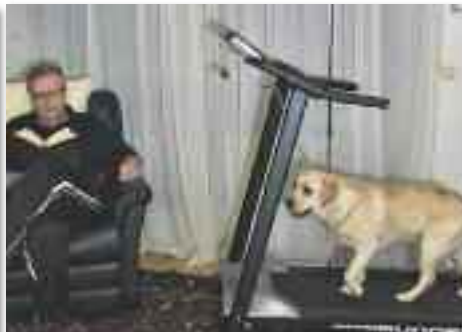
Ötlet lusta gazdinknak